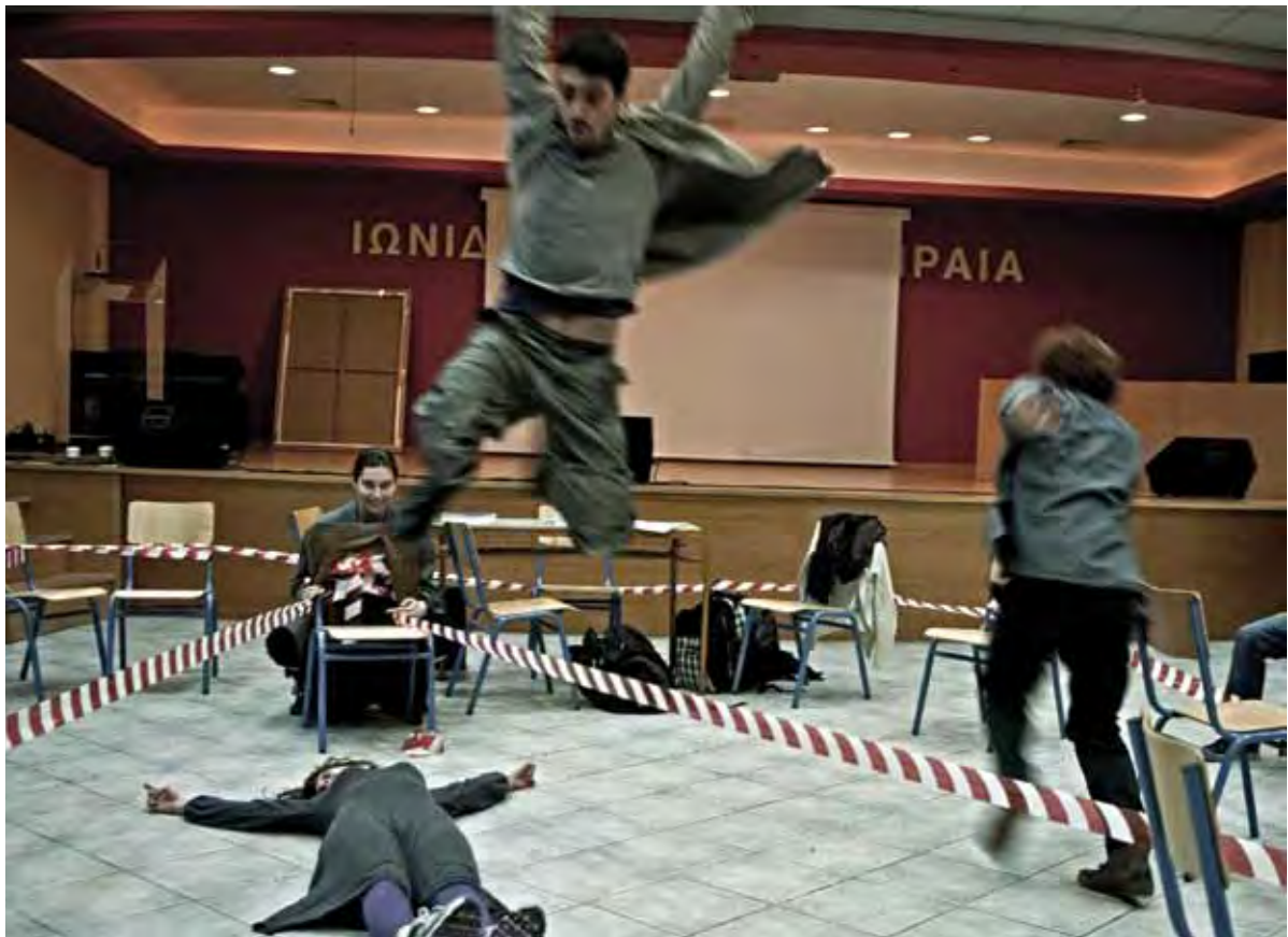
Εθνικό θέατρο, Αντιγόνη

Το θέατρο και οι έφηβοι είναι δύο λέξεις, που, μαζί, δημιουργούν ενδιαφέροντες συνειρμούς. Υπάρχει θέατρο που κάνουν οι έφηβοι, συνήθως το ήμερο σχολικό, στο οποίο συνήθως υποδύονται ενήλικους, υπάρχουν ενήλικοι στο επαγγελματικό θέατρο, στο οποίο υποδύονται τους εφήβους, υπάρχουν θεάματα που απευθύνονται στους εφήβους με ήρωες εφήβους είτε με ήρωες ενήλικες και, σπανιότερα, θεάματα όπου οι ηθοποιοί είναι έφηβοι που υποδύονται ρόλους εφήβων.