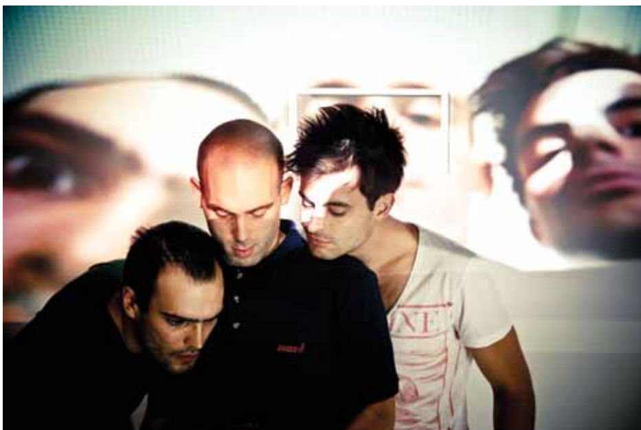
Στην Οθόνη Φως

Στην Αθήνα άρχισε να καλύπτεται ένα κενό, για ένα θέατρο που αγγίζει τους προβληματισμούς και τις ανησυχίες των εφήβων, όπως η σχολική βία, η επίδραση του δικτύου στα ήθη της σύγχρονης εφηβικής κοινότητας, η απόκλιση της νεανικής συμπεριφοράς, η αυτοκτονία, η διαχείριση της απώλειας, η παραβατικότητα και άλλες «δύσκολες» αλήθειες γύρω από την πορεία προς την ενηλικίωση.