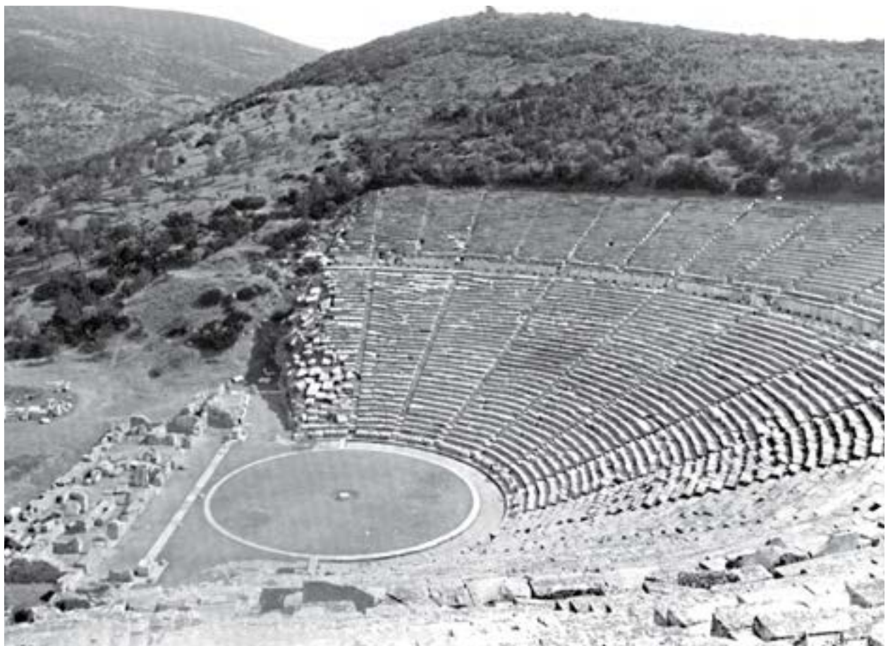
Αρχαίο Θέατρο Επιδαύρου – Άποψη των κατεστραμμένων αναθηματικών τοίχων κάτω Ξ άνω κοίτου, του αποχετευτικού αγωγού, της ορχήστρας, της σκηνής και των πυλών των παρόδων