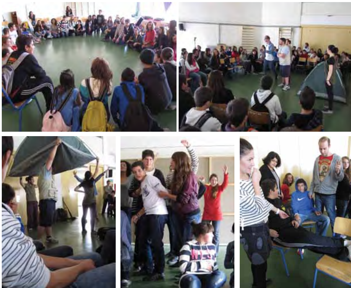
Θεατροπαιδαγωγικό πρόγραμμα μετά την παράσταση «Ορνιθες» της Ομάδας 4frontal, 2011

τέλος της χρονιάς παρουσιάζονται σε ένα κοινό φεστιβάλ, με τη συνδρομή και επίβλεψη επαγγελματιών σκηνοθετών. Άλλοτε, μάλιστα, τα έργα αυτά παίζονται και από επαγγελματίες ηθοποιούς στις αγγλικές σκηνές. Μέσα από τη βιβλιοθήκη αυτή προέκυψε η παράσταση του Έντα Γουόλς «Chatroom», σε σκηνοθεσία Σοφίας Βγενοπούλου, εμπνεύστριας και πρωτεργάτριας του θεσμού στην Ελλάδα.